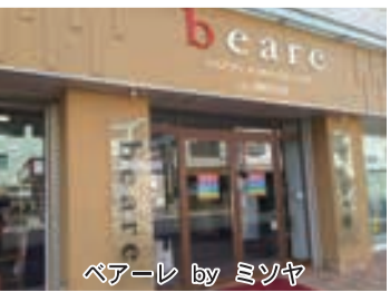
ベアーレ by ミツヤ

町家で、西町(橋本市橋 本一丁目一〇〇六)から 大正期に横町(橋本一丁 目一一一四)に移り現在 では、二〇一七年再び昔 の西町に戻っています。が、 そこを本拠に本業の着物 を販売しています。二〇 年ほど前から東家六丁目 を代々受け継がれてい る様子が感じられ伝わっ てきました。一五八年前 に転業があつて近年では 扱った商品の幅を広げ、時 代と顧客のニーズに合わ せた商いをされています。 折々に知恵を出し時代を 潜り抜けて行く、まじめ に一生懸命の言葉が印象 的でした。代々知恵を出 して、その時代と環境の 変化に合わせていく事が 長く続ける秘訣のように 感じました。