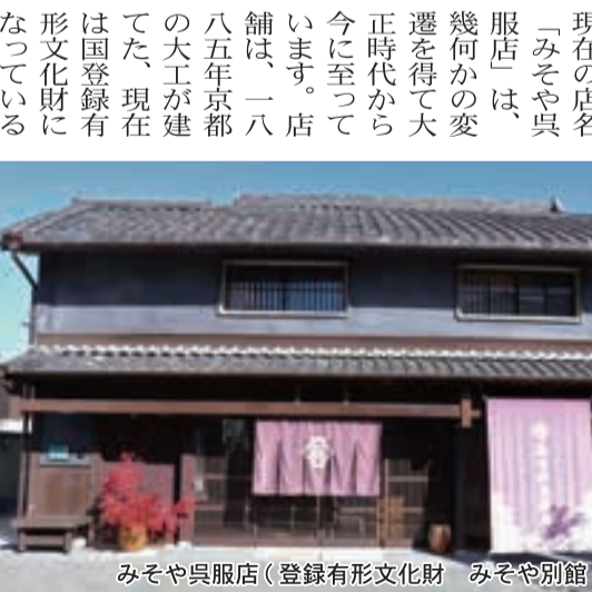
みそや呉服店(登録有形文化財 みそや別館)

町家で、西町(橋本市橋 本一丁目一〇〇六)から 大正期に横町(橋本一丁 目一一一四)に移り現在 では、二〇一七年再び昔 の西町に戻っています。が、 そこを本拠に本業の着物 を販売しています。二〇 年ほど前から東家六丁目 を代々受け継がれてい る様子が感じられ伝わっ てきました。一五八年前 に転業があつて近年では 扱った商品の幅を広げ、時 代と顧客のニーズに合わ せた商いをされています。 折々に知恵を出し時代を 潜り抜けて行く、まじめ に一生懸命の言葉が印象 的でした。代々知恵を出 して、その時代と環境の 変化に合わせていく事が 長く続ける秘訣のように 感じました。