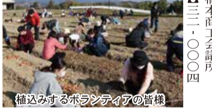
植込みするボランティアの皆様

●球根植込み日時 十一月二十五日(土) ・午前九時 ・午前十時三十分 ・午後一時 ・午後二時三十分 右記の計四回に分けて実施する予定です。予備日は十二月二日(土)です。ボランティアで来ていただく方には、植込み場所を覚えておいていただき、来年の春に、ご自身の目でご覧いただきたいと思います。チューリップ達の成長の様子を、「商工はしもと」に随時掲載予定です。 ●連絡先 橋本商工会議所 ☎三二・〇〇〇四