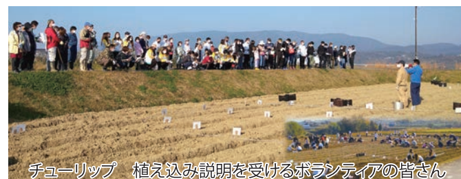
チューリップ 植え込み説明を受けるボランティアの皆さん