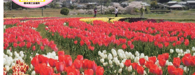
恋のチューリップ川