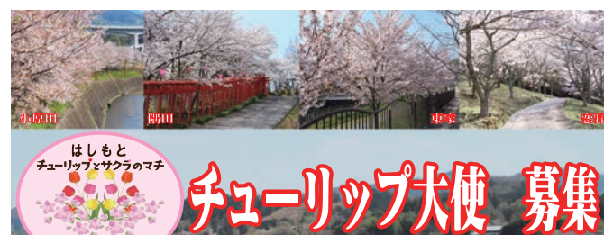
はしもとチューリップ大使のまち